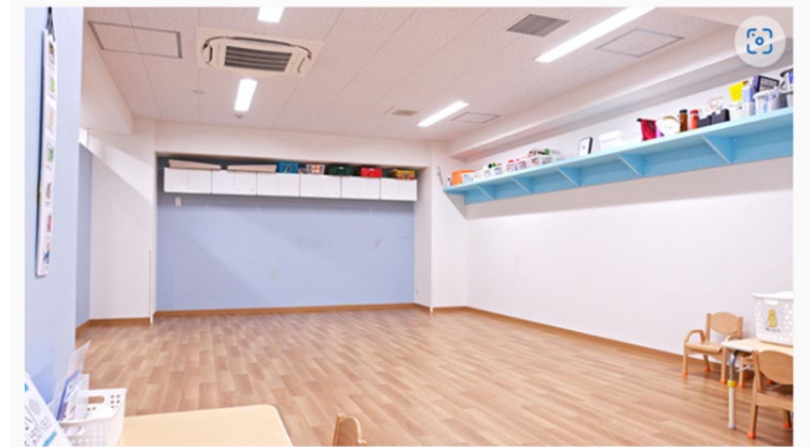
板橋区役所前教室